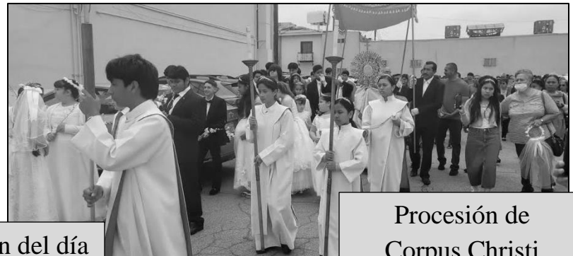
Procesión de Corpus Christi