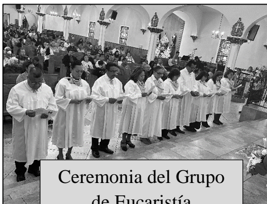
Ceremonia del Grupo de Eucaristía