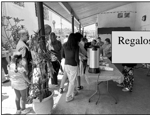
Regalos y celebración del día del padre.