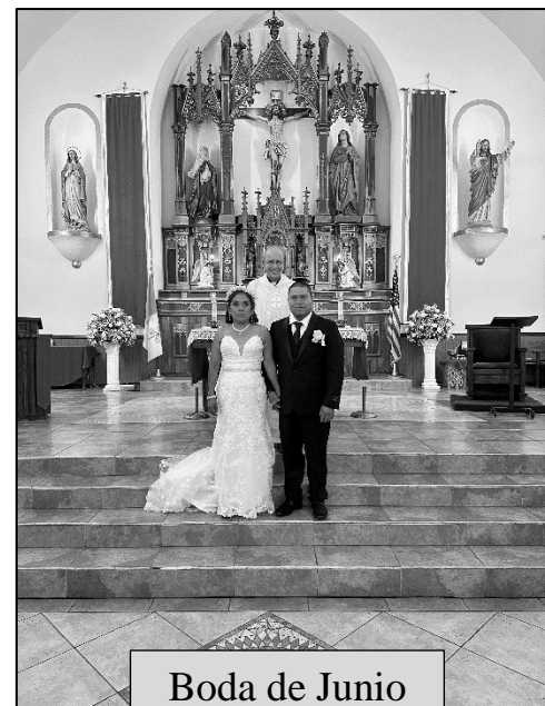
Boda de Junio